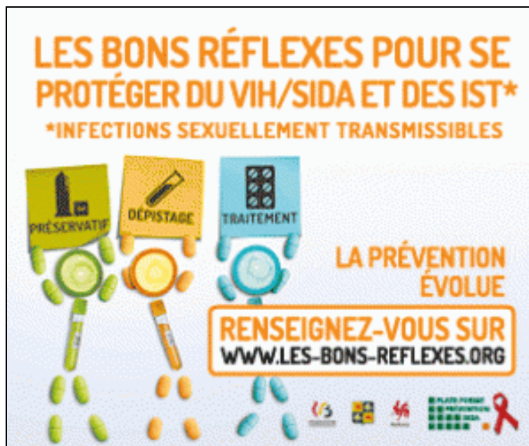
Plate-Forme Prévention Sida.

Disponible sur preventionsida.org (consulté le 20 juin 2018).